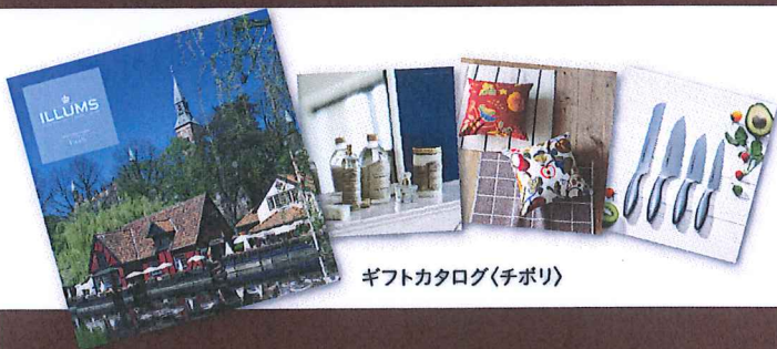
ギフトカタログ(チボリ)