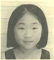
C部門 銀賞 真中 滯